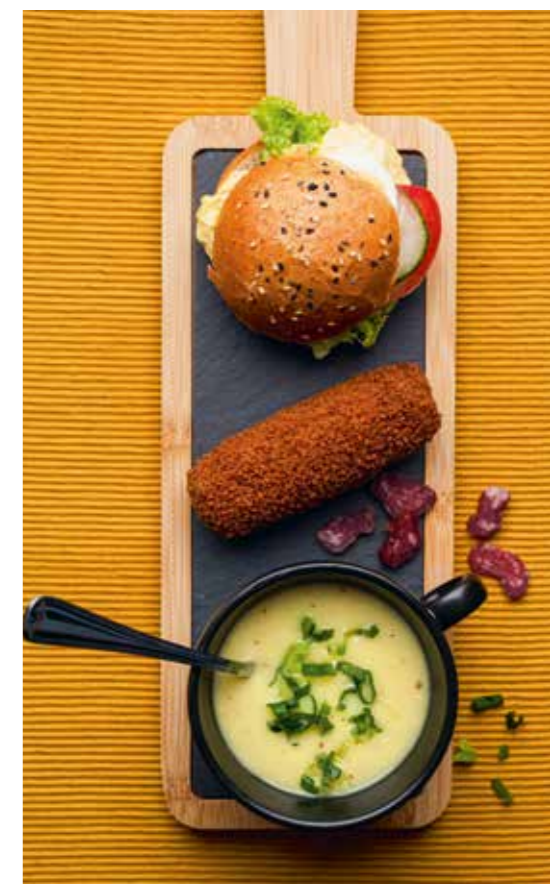
▲ Een twaalf-uurtje biedt alles in één.

De specifieke mogelijkheden en arrangementen zijn te vinden in de tarieflijst achterin deze brochure.